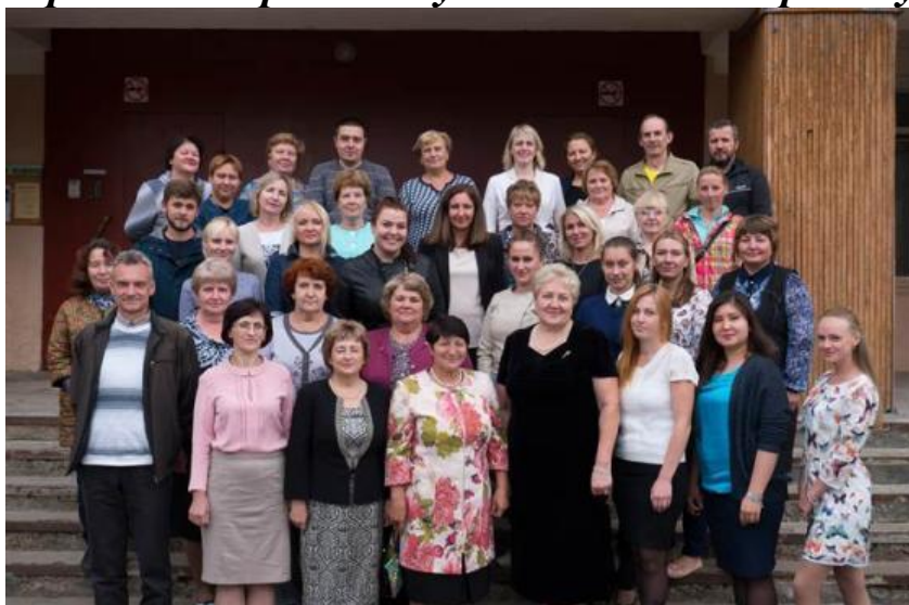
Коллектив учителей 2017-2018 учебного года

Счастья! Здоровья! Творческих успехов! Благодарных учеников!