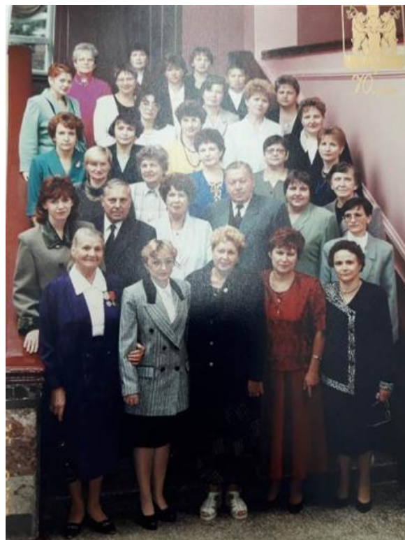
Коллектив учителей 1999 года на Августовской районной конференции

Учителя-пенсионеры во время дружеской встречи в кабинете директора школы